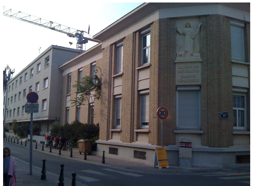
Photos de l'EHPAD avant sa démolition reconstruction