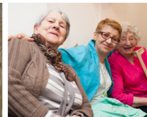
Accompagnement des personnes âgées pendant les travaux de réhabilitation.