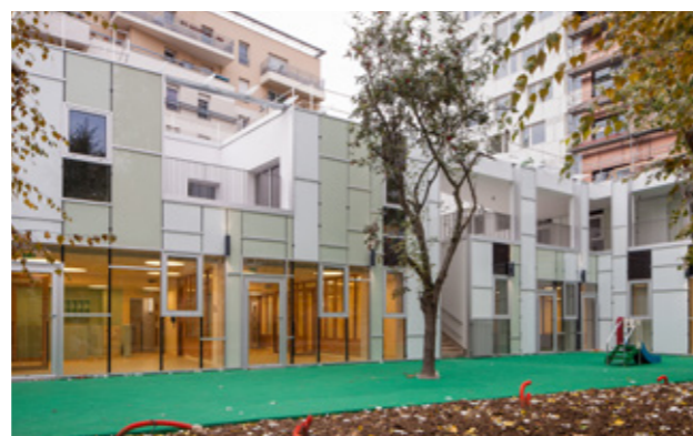
Crèche de 60 berceaux, rue de Charolais, Paris 12.